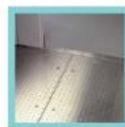
panneaux de sol ép.60,100 ou 150 mm